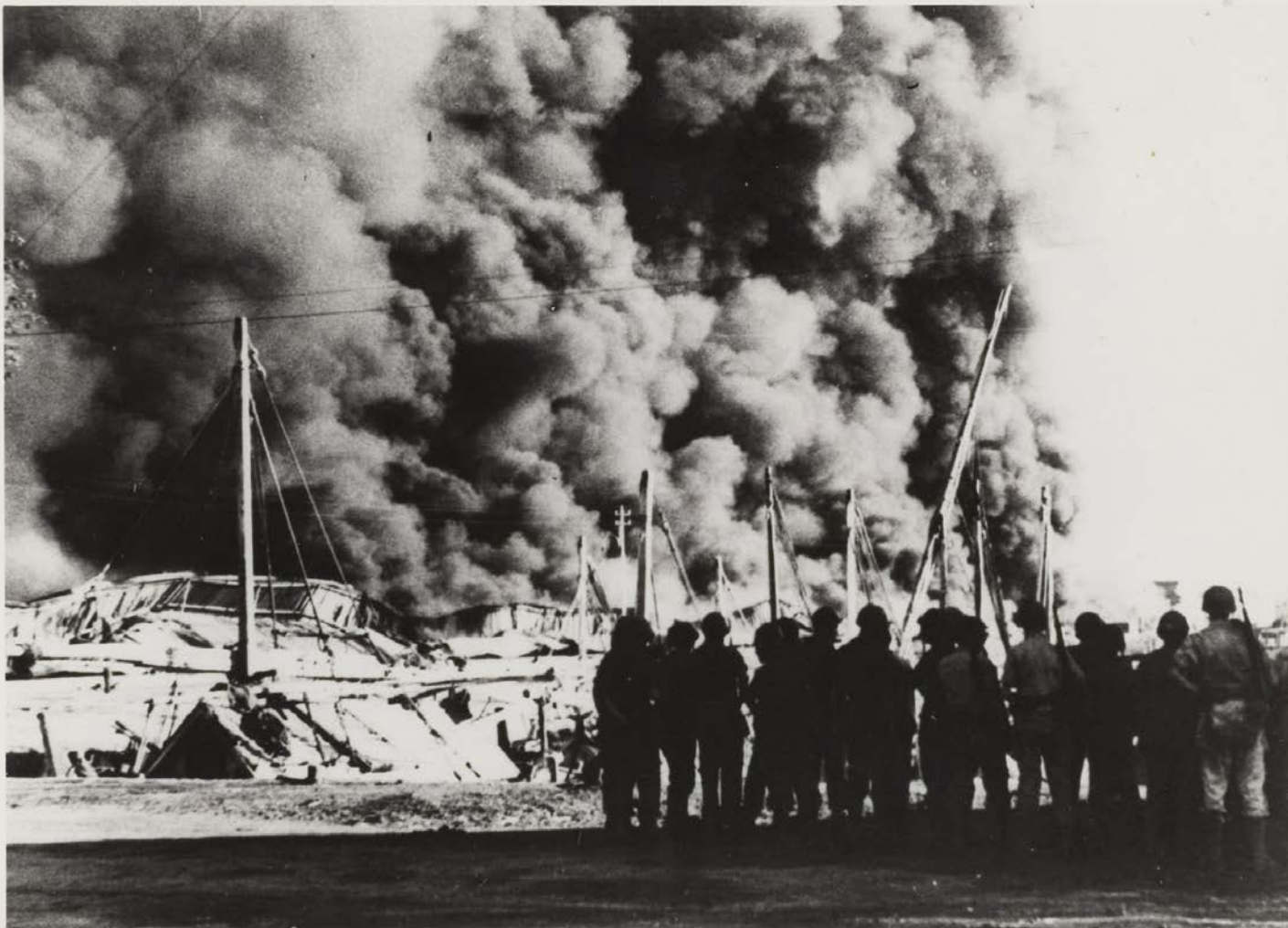
Havenloodsen in brand tijdens de eerste politionele actie op Oost-Java, RVD Batavia, juli 1947